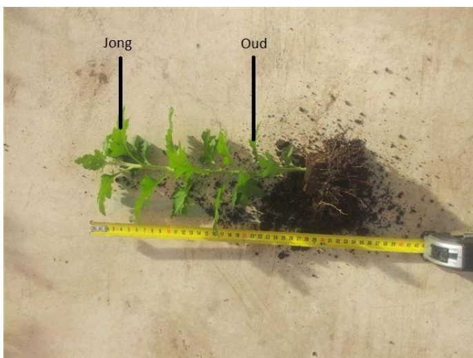
Afb. 2: Plant van 2 weken oud