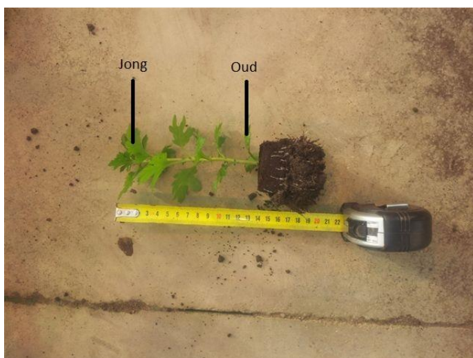
Afb. 1: Plant van 1 week oud

Bemonster het jongste volgroeide blad en het oudste vitale blad. Bij jonge planten zullen de onderste 2 bladeren als oud vitaal gelden en de eerste 2 volledig uitgevouwen bladeren van boven gelden als jongst volgroeid (zie afb. 1,2 en 3).