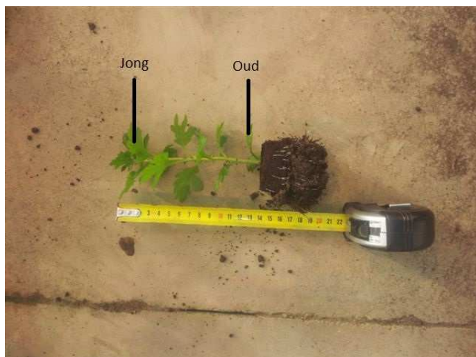
Afb. 1: Plant van 1 week oud

Bemonster het jongste volgroeide blad en het oudste vitale blad. Bij jonge planten zullen de onderste 2 bladeren als oud vitaal gelden en de eerste 2 volledig uitgevouwen bladeren van boven gelden als jongst volgroeid (zie afb. 1,2 en 3).