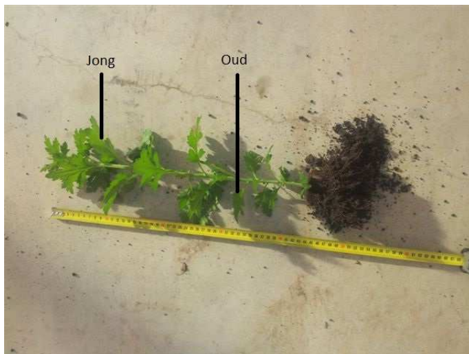
Afb. 3: Plant van 3 weken oud